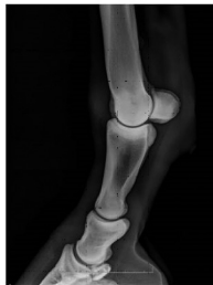
Doigts: profil (incluant articulation interphalangienne proximale)