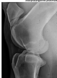
Grasset: profil OU oblique caudo-latérale