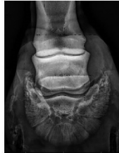
Pieds: profil à l'appui et face au soutien sur cale à 60°, déferlés e lacunes comblées