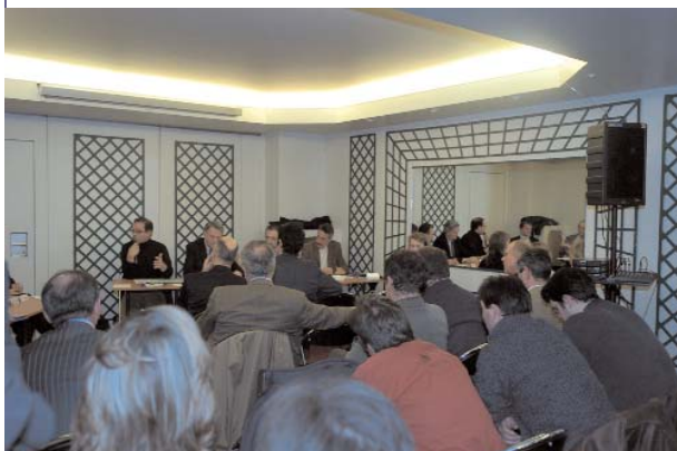
TABLE RONDE N°2 (suite)