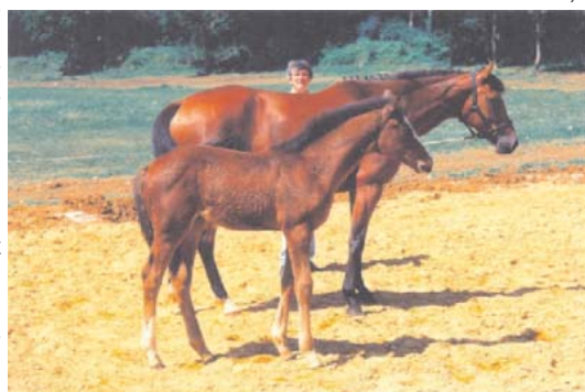
Diane du Chaufour SF suivie d'Hotess de Rosières SF

soeur de Diane. Hotess de Rosières SF démontre s'il le fallait que l'élevage de l'est de la France n'a rien à envier aux autres régions, et ouvre la voie à d'autres exportations heureuses.