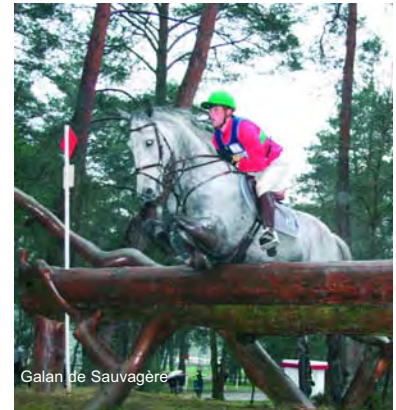
Galan de Sauvagère