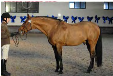
<< Favoritas (Hamanas* Kokus) facteur de SFB