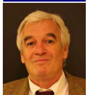
Yves Chauvin, nouveau Président de l'ANSF