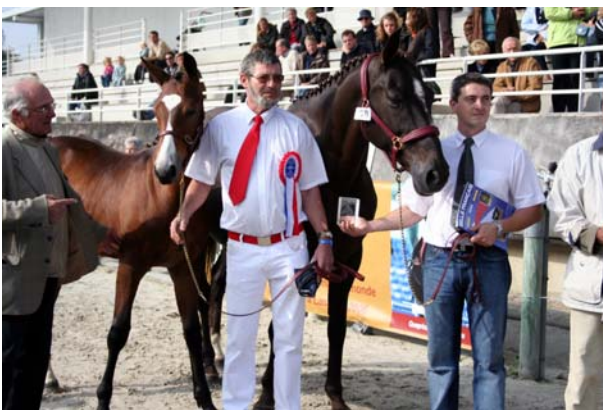
Spécial de Condé SF (par Idéal de la loge sf et Esther de Condé sf par Hopal Fleury sf ), né chez André Daloz (55), vainqueur des mâles âgés chez les foals.