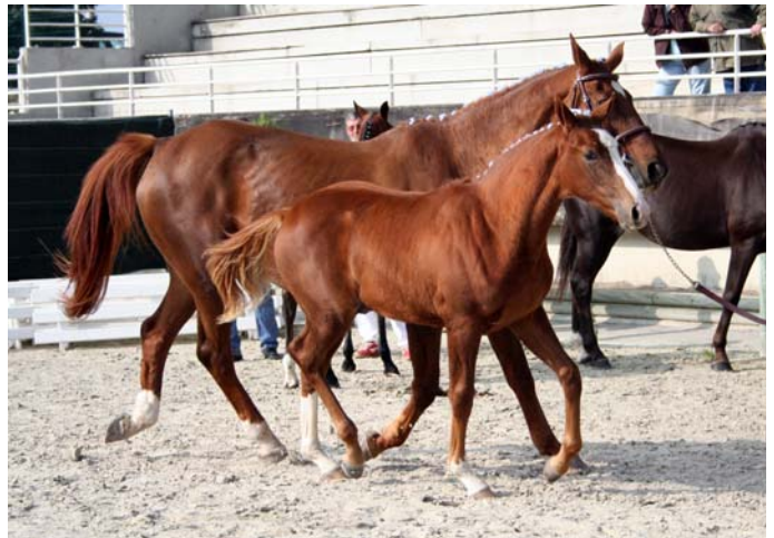
Saphir du Vinnebus SF (par Papillon Rouge sf et Polka du Vinnebus sf par Count Ivor (US) ps ), né chez Rémi Mesnil (50), vainqueur des jeunes foals mâles.