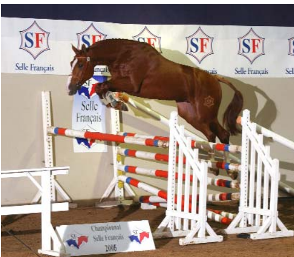
Pommeau du Heup SF (par Hélios de la Cour II sf et Jamie du Heup sf par Thurin sf ), Champion Suprême des Etalons de 3 ans 2006.