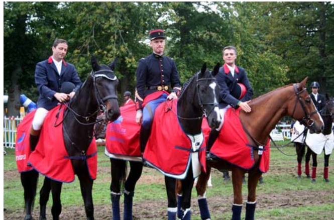
Les trois Selle Français vainqueurs du Trophée des Races, de gauche à droite : Lord de Lignières SF (x Hand In Glove ps ), Mistral de Texes SF (x Urbain du Monnai sf ) et Mozart de Bonneville SF (x Caucalis sf ).

Grâce à ses trois classements, le stud book Selle Français remporte avec une belle avance le Trophée Mondial des Races devant l'Irish Sport Horse et l'Anglo-arabe.