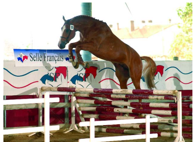
Phidam du Hille SF (xQuidam de Revel sf) leader à Saintes.