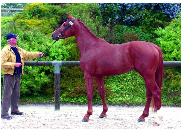
Patch du Havre SF (xFélicite du Pas sf) meilleur candidat 2006.