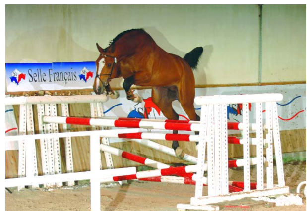
Pourpre du Mûrier SF (xRobin II Z) leader au Lion d'Angers.