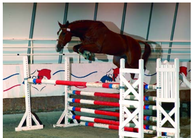
Pommeau du Heup SF (xHelios de la Cour II sf) 2e meilleur candidat 2006.