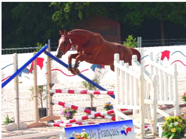
Pegase de Talma SF (xDollar du Mûrier sf) leader à Compiègne et 3e meilleur candidat sur les qualificatives.