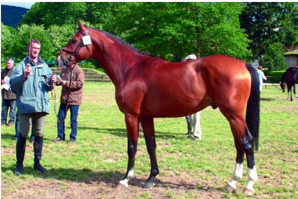
Premier du Grand Pré SF (xQuidam de Revel sf) leader à Cluny.