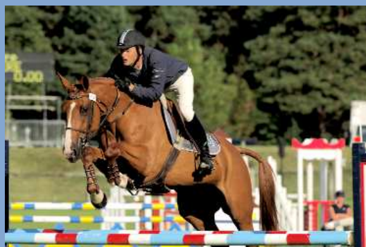
Nola de Cosnière SF

pouliches ont obtenu une note supérieure à 30 sur 40 au modèle : il s'agit d' Orchidée des Vents SF (x Damoiseau d'Or sf ) et Osiris des Prés SF (x Papillon Rouge sf ). Aux allures, Oelia du Montois SF (x Kannan ) et Osmonde de Preuilly SF (x Damiro B ) obtiennent une note supérieure à 23 sur 40. La parade des 15 finalistes sur le Grand