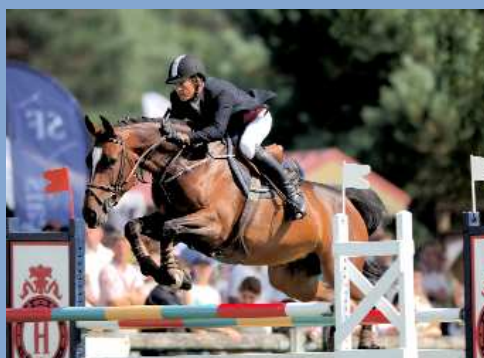
Myrrha d'Orion*Alia SF