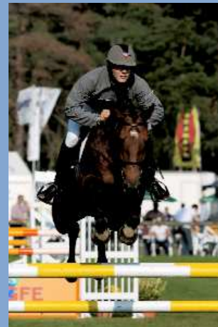
Moustic des Salines SF