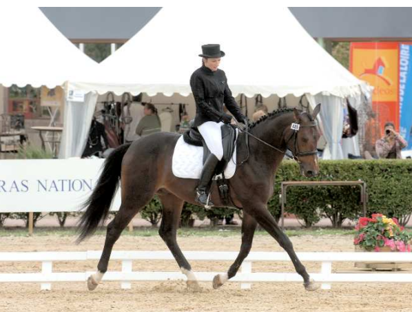
Narkos de Preuilly SF (x Drakkar des Hutins sf), vainqueur du Trophée ANSF et meilleur SF du Championnat des 4 ans

Le second Elite, Lutin des Neiges SF , réitère ses performances. Il se qualifia en effet à 4 et 5 ans pour la finale et obtenait l'an passé l'indice dressage de 120. Lutin propose des origines SF orientées CSO, avec Livarot SF comme père, sur une souche Onyx Blond II SF x Lama des Landières SF .