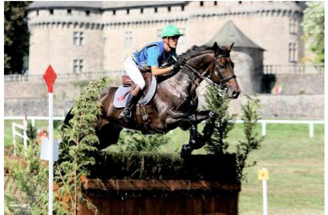
Lesbos SF (x Yarlands Summersong ), Champion des 6 ans aux pieds du château de la Comtesse.

Bien que d'un déroulement différent (reprise simplifiée, parcours de 6 obstacles et cross de