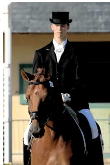
Mister Grand Champ SF (x Rohdiamant), Elite et 4ème des 5 ans