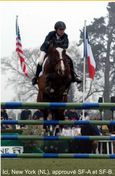
Ici, New York (NL), approuvé SF-A et SF-B.

La recherche s'effectue par nom et/ou par n°SIRE et/ou par race. Dans le cas où vous n'auriez pas trouvé ainsi, un mode "Recherche avancée" est également disponible en cliquant sur "Avancé" sur la page initiale de recherche.