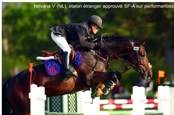
Nirvana V (NL), étalon étranger approuvé SF-A sur performances.

ou sur le site Internet www.sellefrancais.fr . Faire la demande par téléphone (01.46.12.34.01) ou par e-mail ( info@sellefrancais.fr ).