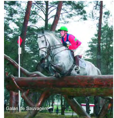
Galan de Sauvagère