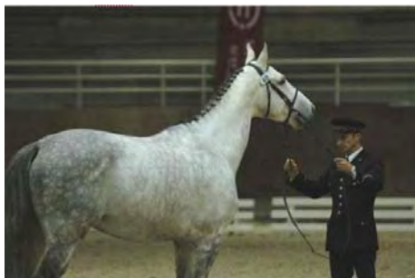
<< Orphée du Faget (Fusain du Defey*Narcos II) facteur de SFB

Voici la liste des nouveaux étalons dont les dossiers sont complets et enregistrés auprès de SIRE :